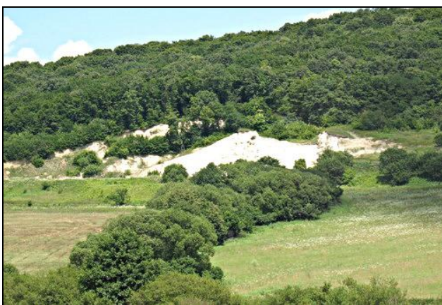
Фот. 3. Ареалы лесов на территории Предкарпаття Fot. 3. Obszary leśne na obszarze Podkarpacia Photo 3. Forest areas in the territory o Precarpathians

погенной преобразованности. Для количественного расчета этого показателя избрана методика П. Г. Шищенко (1988), согласно которой можно определить всю полноту антропогенного давления на составные компоненты агроландшафтов региона. Коэффициент антропогенного превращения определяется за следующей формулой: